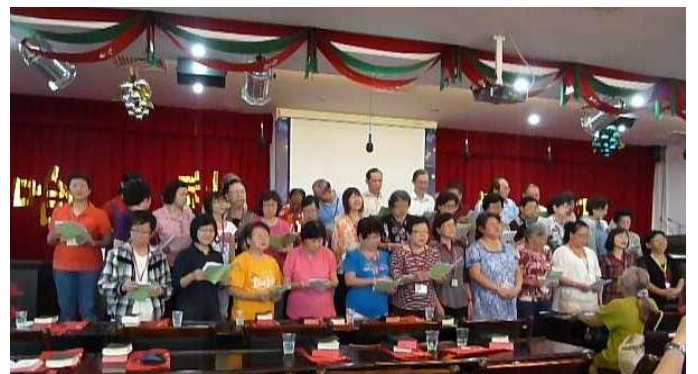
在“哈利路亚教会”的主日崇拜献唱