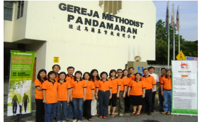
班达马兰卫理公会推展家庭事工团队