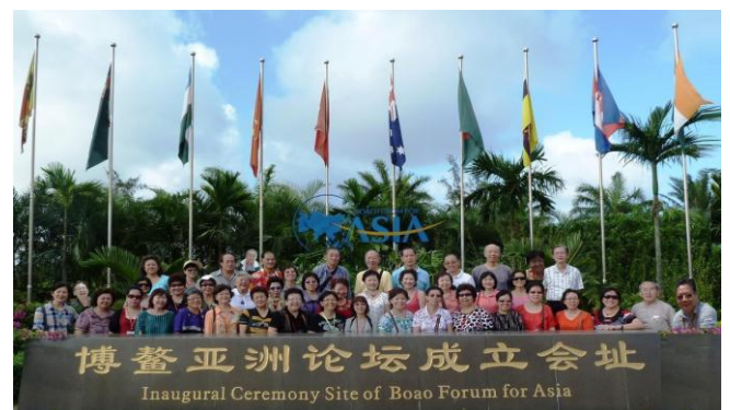
海南岛乐龄丰盛生命营

众所周知乐龄事工乃是这些年来主流教会所关注的事工，我们也为乐龄人士设计了丰盛他们的生命的节目：于九月底在海南岛举办了两天三夜的生命丰盛营暨三天的旅游活动；我们感到无限的欣慰，看到这45位团员的表态和合作精神并积极领受每一堂讲座和工作坊的亮光，改进了他们对自己的心态和夫妻关系，