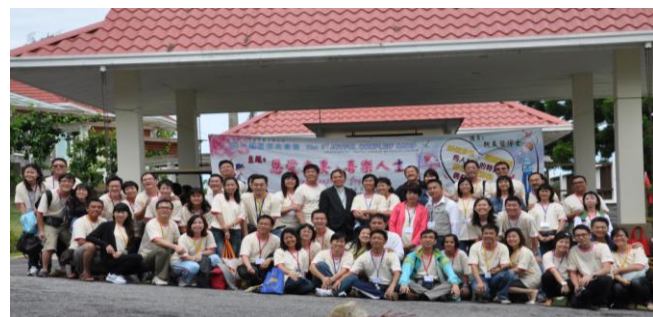
太平卫理公会丰盛婚姻营

不然，为了引起学员的配偶的兴趣并方便他们邀请其配偶（包括不信主的配偶）参加丰盛婚姻课程，每年在恰当的时间举办丰盛婚姻营；营会后积极鼓励他们与其他四对夫妻组成一个守望小组。在小组里引导学员如何爱他们的邻舍（配偶）如同爱自己一样。过后，五对的夫妻将会彼此认识而信任，他们就很自然的成立了守望小组，并以《基督化家庭生活指南》为分享的资料；最终，他们就以《家庭祭坛系列》来装备他们在各自的家里主持家庭祭坛而建立基督的身体。